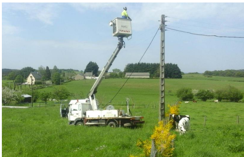
(Travaux au Jouanas suite à la baisse de tension électrique)

Suite aux baisses de tension électrique rencontrées chez M. Pater de la croix del Gal ainsi qu'au Jouanas, un poste de transformation supplémentaire sera ajouté sur ces lieux. Les fils de cuivre aériens qui alimentaient le Jouanas et ses alentours seront remplacés par des câbles torsadés qui permettront une meilleure conductivité de l'électricité. Ces travaux seront terminés début septembre et sont pris en charge par le SIEDA (syndicat intercommunal d'électrification départementale de l'Aveyron).