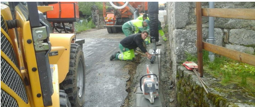
(Travaux d'aménagement du cœur de village à La Capelle)

L'aménagement du cœur de village de La Capelle se termine. L'entreprise EGTP d'Espalion a collecté les eaux pluviales, a procédé au terrassement de la voirie et a posé les caniveaux et les bordures. Il reste à aménager le petit parvis autour du monument aux morts et terminer le revêtement final de la route qui traverse le village. L'entreprise Jouclard a bâti des murets autour de la place pour maintenir le terrain, a déplacé le calvaire et a réalisé un emplacement pour les containers à ordures. La mise en valeur par des projecteurs au sol, du monument aux morts et du calvaire sera effectuée par l'entreprise Eiffage. Des travaux d'accessibilité ont été effectués devant la salle des fêtes grâce au remblai récupéré lors du terrassement de la route qui a permis de combler la pente de la cour d'accès.