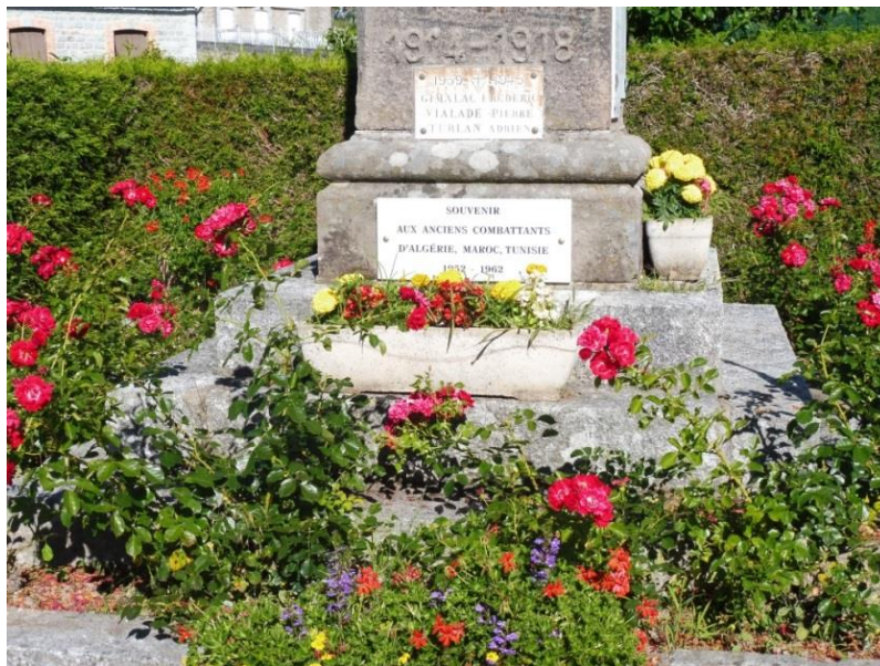
( monument aux morts avec la plaque souvenir des combattants d'Afrique du Nord)

Une plaque en souvenir des combattants d'Afrique du Nord a été apposée sur les deux monuments de la commune.