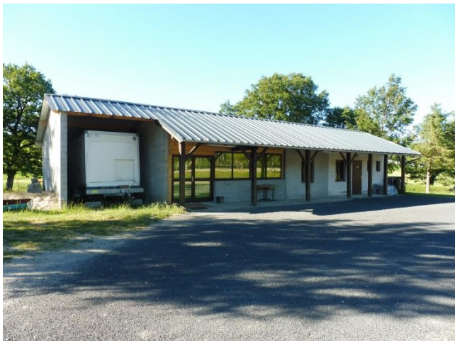
(Ancien local des quilles rénové)